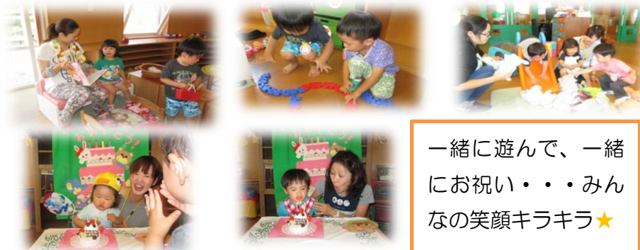
一緒に遊んで、一緒にお祝い・・・みんなの笑顔キラキラ★