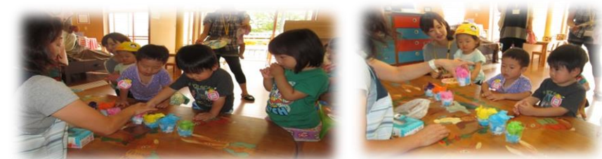
今度は、僕がつくったんだよ!わたしが一人で作ったんだよ!

★「うちわばたばた」・・・絵本から、本物のうちわばたばた絵本で、視覚的な体験のうちわから、実体験へ・・・