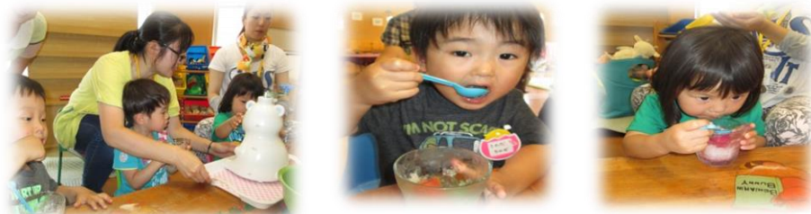
まずは、ママと一緒にかき氷をつかったよ～