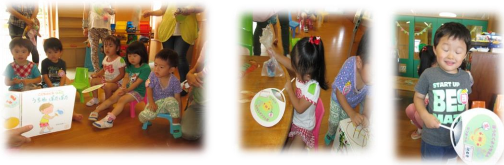
絵本では、わからなかった、発見がいっぱい！！